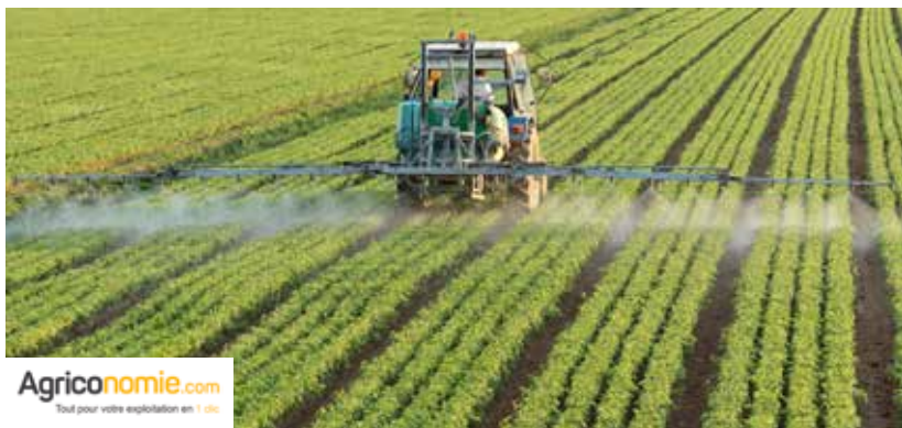
Agriconomie.com Tout pour votre exploitation en 1 clic

L'innovation nécessite d'importants besoins en capitaux mais elle reste le gage de la croissance. Persuadée des vertus de cette équation, Idinvest Partners a financé plusieurs entreprises innovantes au cours du second semestre 2016 dans les secteurs du Digital, des Energies & Cities et de la Santé